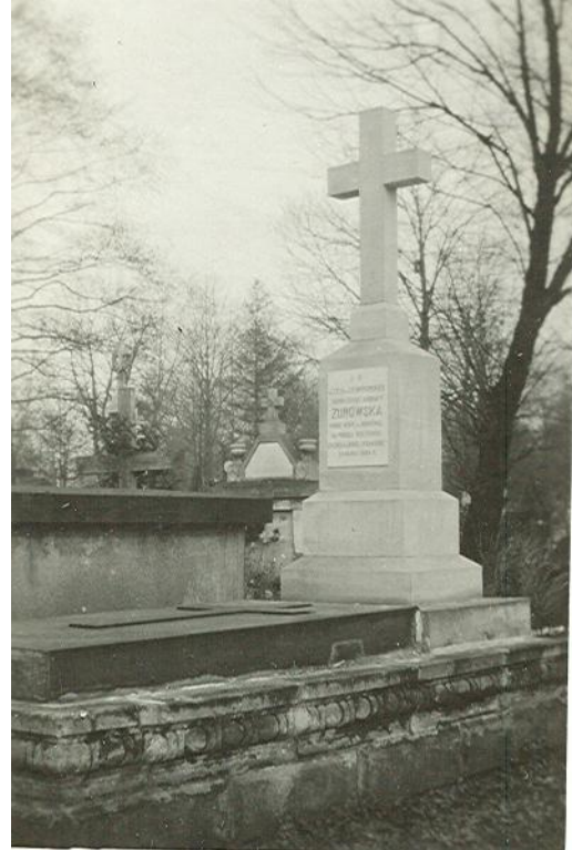
Grób Cecylii z Stempkowskich w cmentarzu rakowickim w Krakowie