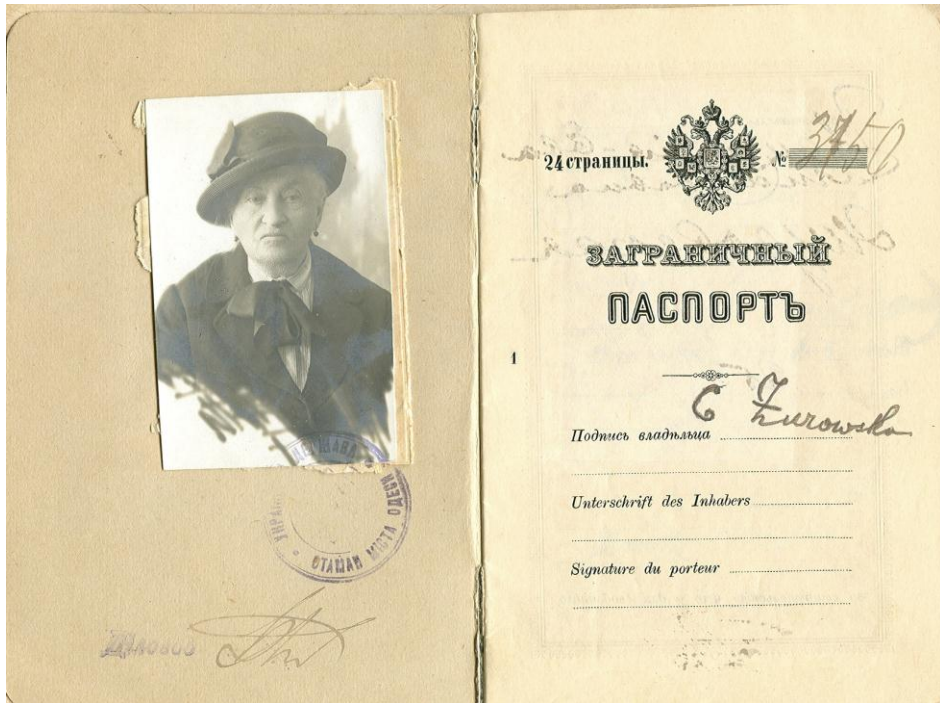
Пaszport rosyjski Cecylji Stempkowskiej-