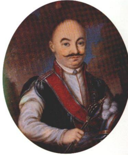
Wojewoda Józef Stempkowski

(Nagielski, op. cit., str. 385-392, Rolle, op. cit., str. 53, Eustachy Iwanowski, „Listki wichrem do Krakowa z Ukrainy Przyniesione: Rodział VI Stempkowski, regimentarz, wojewoda kijowski i jego stryjeczni wnukowie”, tom 2, Kraków, 1901, str. 87-98, Jan-Duklan Ochocki, Pamiętniki, Warszawa, 1910, tom 1: str. 182-233, 292-3, 419-437, 72-9, 111-141, 312-5, tom 2: 2-5, 214-19).